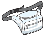
Bolsa cangurera transparente