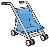
Carriolos o carritos; el bebé o niño debe estar presente